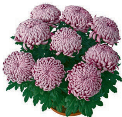
23228 | Malabar Violet R 9,5 4:+++ L ☼