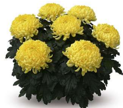
23206 | Passionnement Jaune R 9 4:+++ L ☼