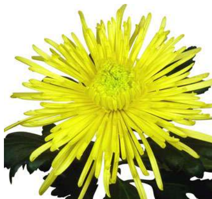
24103 | Spiro Yellow R10,5 4:+++ L ☼