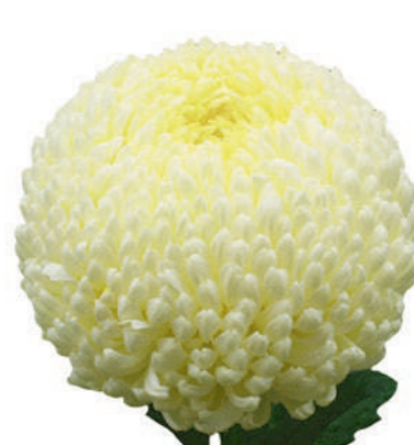
24004 | Creamist White 4:+++ L