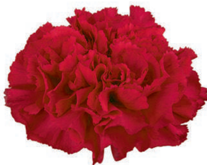
77853 | Lucy 5:+++ 4:✓✓