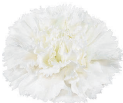
77872 | Holly 1:++ 2:✓✓