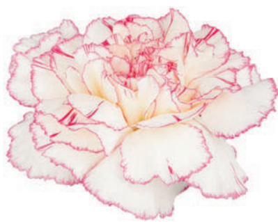
18595 | Pastel Damascus 5:+++ 4:✓✓✓