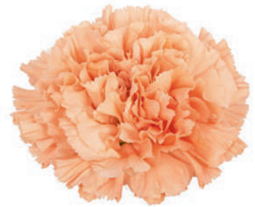
77854 | Saona ☼++ ✨✓✓