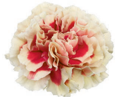
15777 | Wow ☼++ ✨✓✓