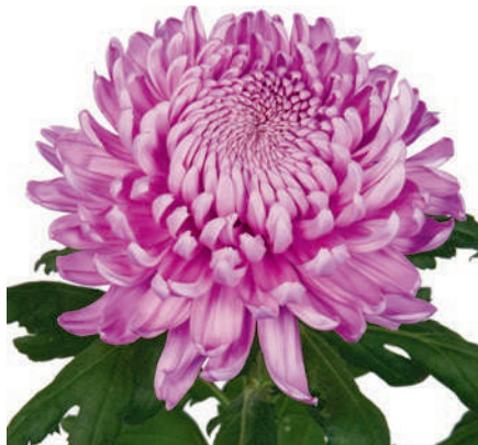
24099 | Hornbill Dark R8,5 4:+++ L ☼