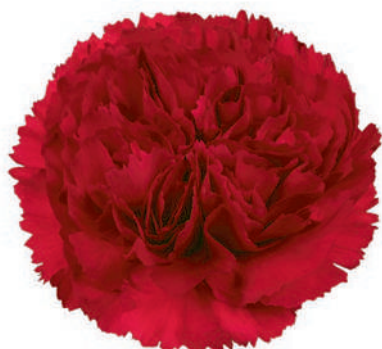
15778 | Ivy 1:++ 2:✓