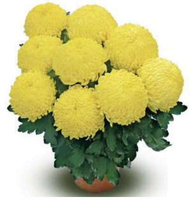
23073 | Sunberry Cream R 10 £:+++ L ☼