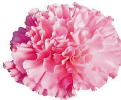
77847 | Tonic Golem ☼+++ ✨✓✓