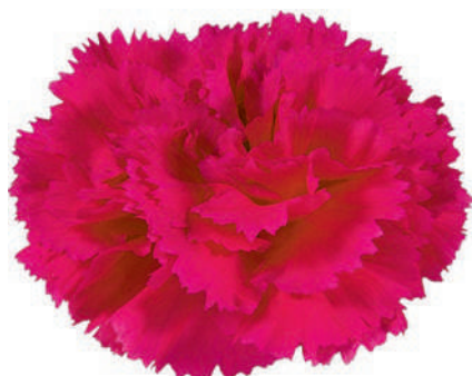
18593 | Cervantes 1:++ 2:✓✓