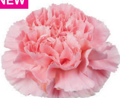
14952 | Julia 1:+++ 2:✓✓