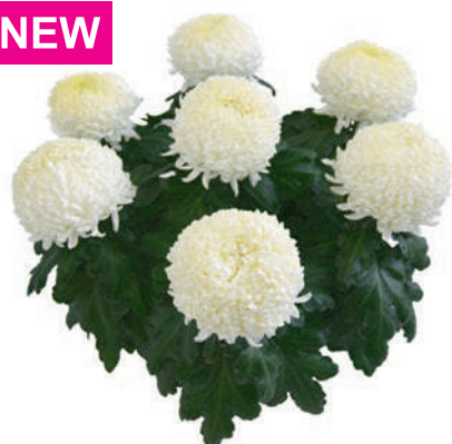
23168 | Ismara Blanc R 10 4:++ L ☼