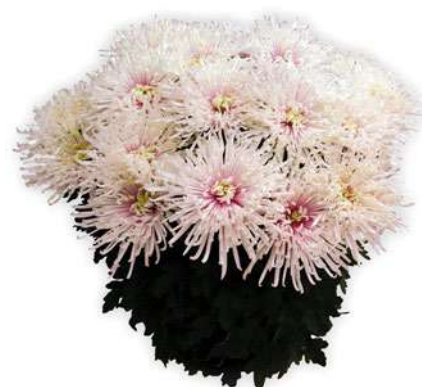
23056 | Chusan Blanc R 9 4:++ L ☼