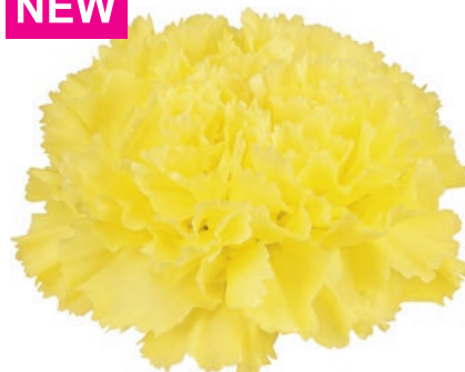
15785 | Kiro 1:+++ 2:✓✓