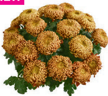
23174 | Bafara R 10,5 4:++ L ☼