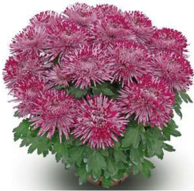
23071 | Santosh Violet R 9,5 £:+++ L ☼