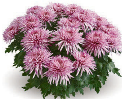
23076 | Garba Rose R 9,5 4:++ L ☼