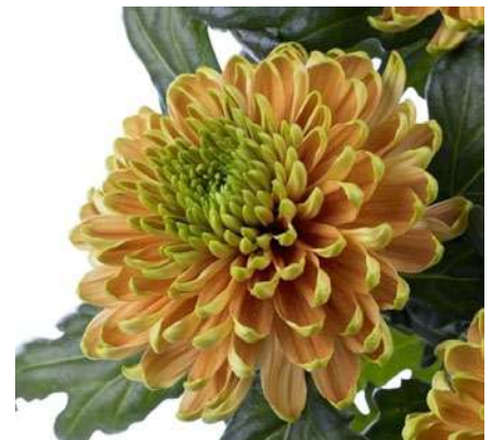
24088 | Rossano Elizabeth R8 4:++ L ☼