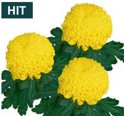
23126 | Mimizan R 9 4:+++ L ☼