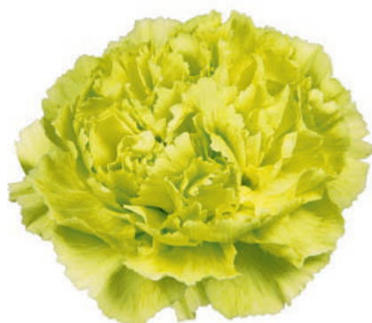
77844 | Marty 5:+++ 4:✓✓