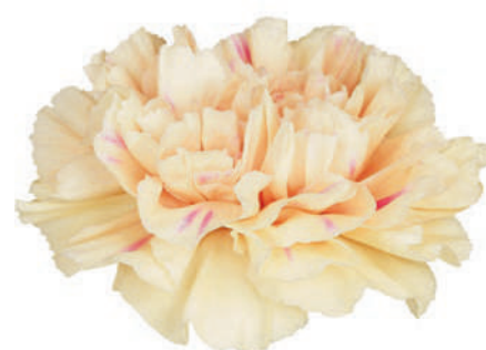
18590 | Apple Tea ✂️+++ ✨✓✓