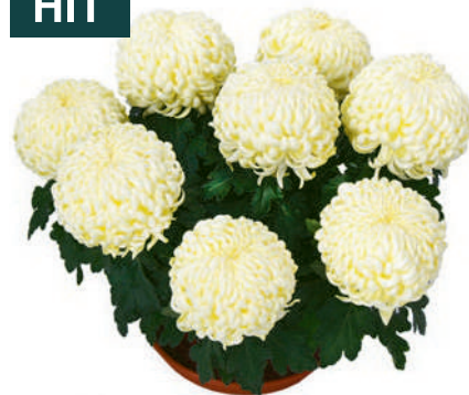
23226 | Komodo Creme R 10 4:+++ XL ☼