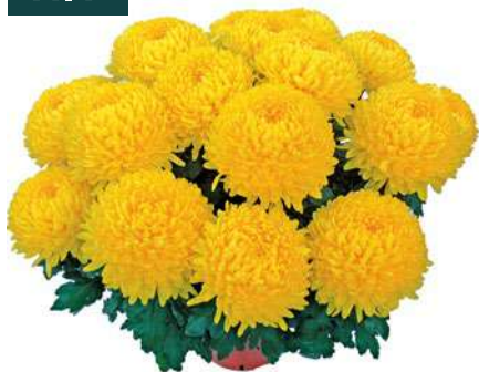
23097 | Etincel Yellow R 10 4:++ L ☼