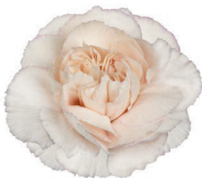
77867 | Bridal Damascus 1:+++ 2:✓✓