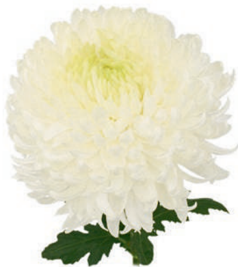
24043 | Magnum White R8 4:++ L ☼