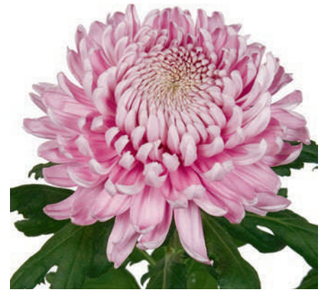
24098 | Hornbill R8,5 4:+++ L ☼