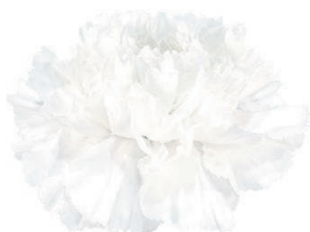
77857 | Delicia 1:++ 2:✓✓