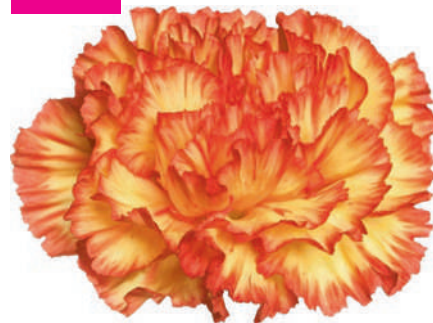
15779 | Zenit ☼+++ ✨✓✓