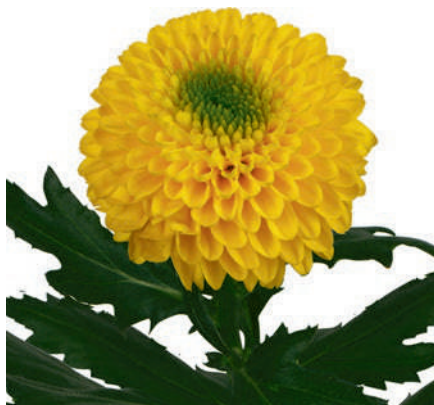
24092 | Brasiliana R7 4:+++ M