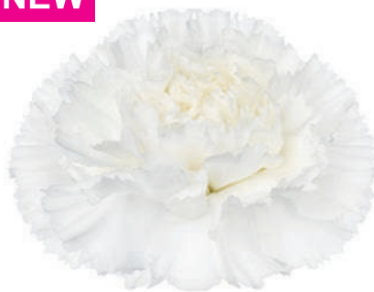
14954 | Alba ✂️+++ ✨✓✓