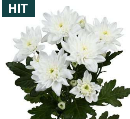
25260 | Pina Colada R7 4:+++ M