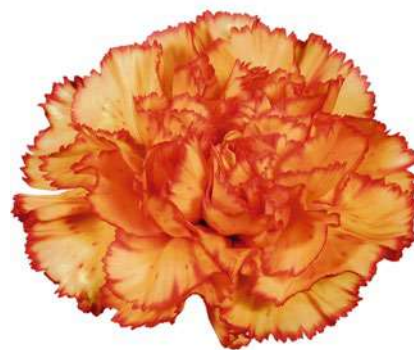
77868 | Madame Augier 5:+++ 4:✓✓