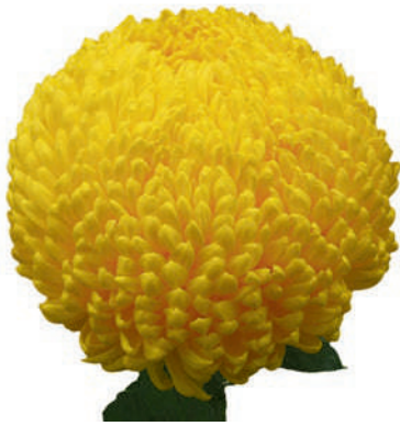
24005 | Creamist Yellow 4:+++ L ☼