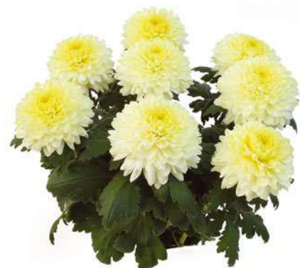
23012 | Intrepid R 9 4:+++ L ☼