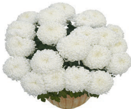
23225 | Komodo Blanc R 10 4:+++ XL ☼