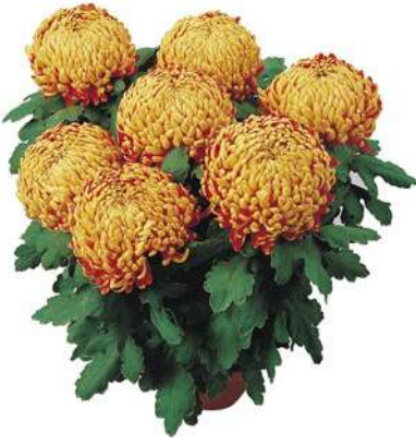
23089 | Passionnement Rouge R 9 £:+++ L ☼