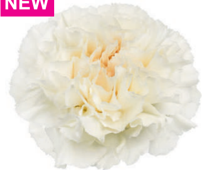
15783 | Peach Tea 5:+++ 4:✓✓✓