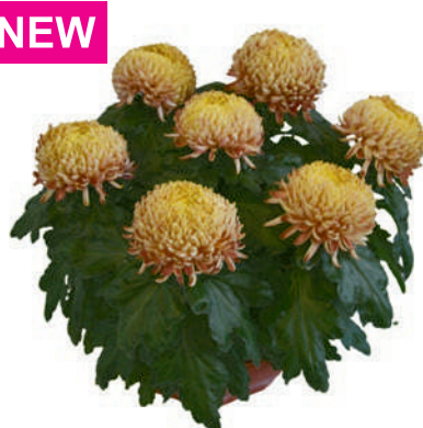
23177 | Ismara Dore R 10 4:++ L ☼