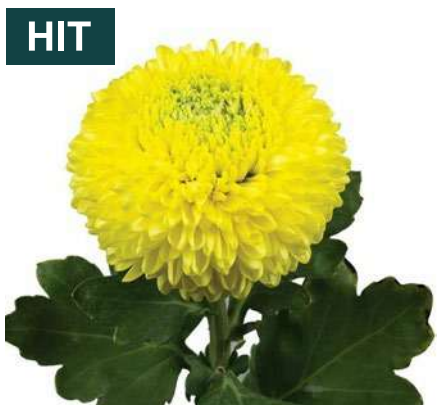
24026 | Boris Becker Yellow R8,5 4:+++ M