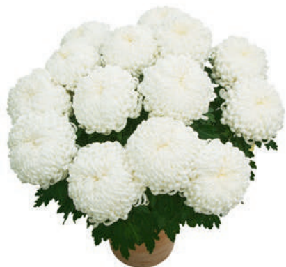
23205 | Antares Blanc R 10 4:++ L ☼