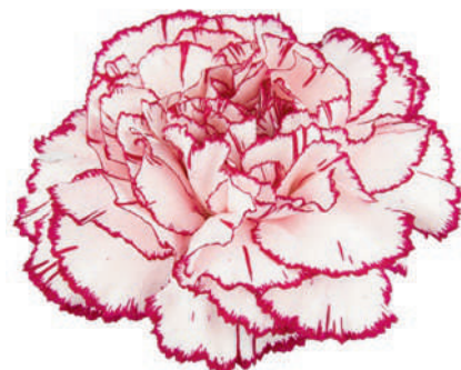
77845 | Damascus 1:+++ 2:✓✓