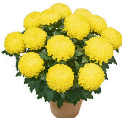
23088 | Caracas Jaune R 9,5 4:++ L ☼