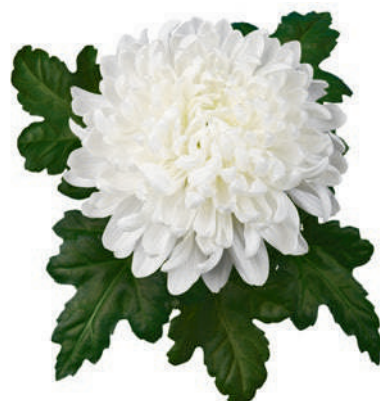
24053 | Antonov R8 4:+++ L