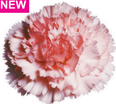
15789 | Big One 1:+++ 2:✓✓