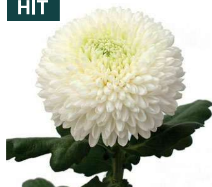
24025 | Boris Becker R8,5 4:+++ M