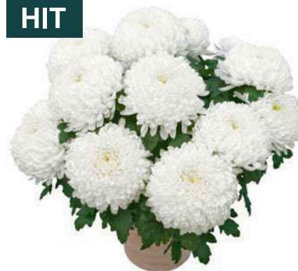
23235 | Nikita Blanc R 9 4:+++ L ☼