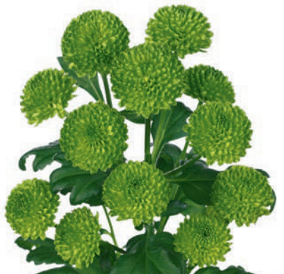
22012 | Country R7 4:+++ S