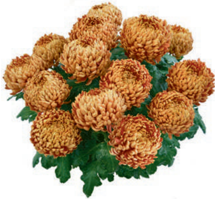
23169 | Roi Johnny R 9 £:+++ L ☼