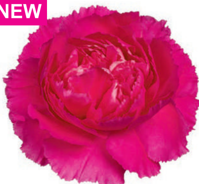
15781 | Cherry Damascus 1:+++ 2:✓✓