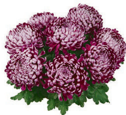
23234 | Nevada Violet R 10 4:+++ L ☼