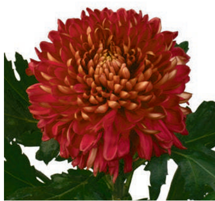
24105 | Hornbill Salmon R8,5 4:+++ L ☼