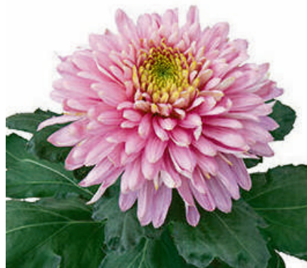
23102 | Sunkiss Pink R 9,5 £:+++ L ☼