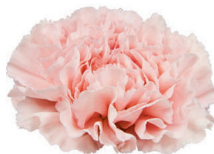
18589 | Alcazar ✂️+++ ✨✓✓