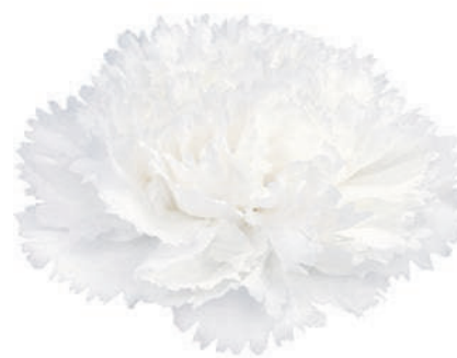
18596 | Baltico ✂️+++ ✨✓✓