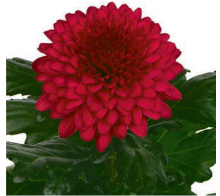
24094 | Lamira Red R7,5 4:++ M ☼