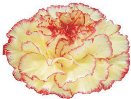
77869 | Lorca 5:+++ 4:✓✓