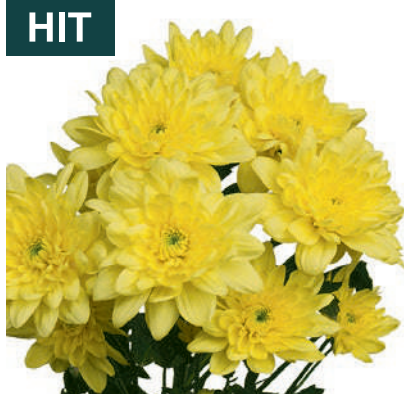
25261 | Pina Colada Yellow R7 4:+++ M