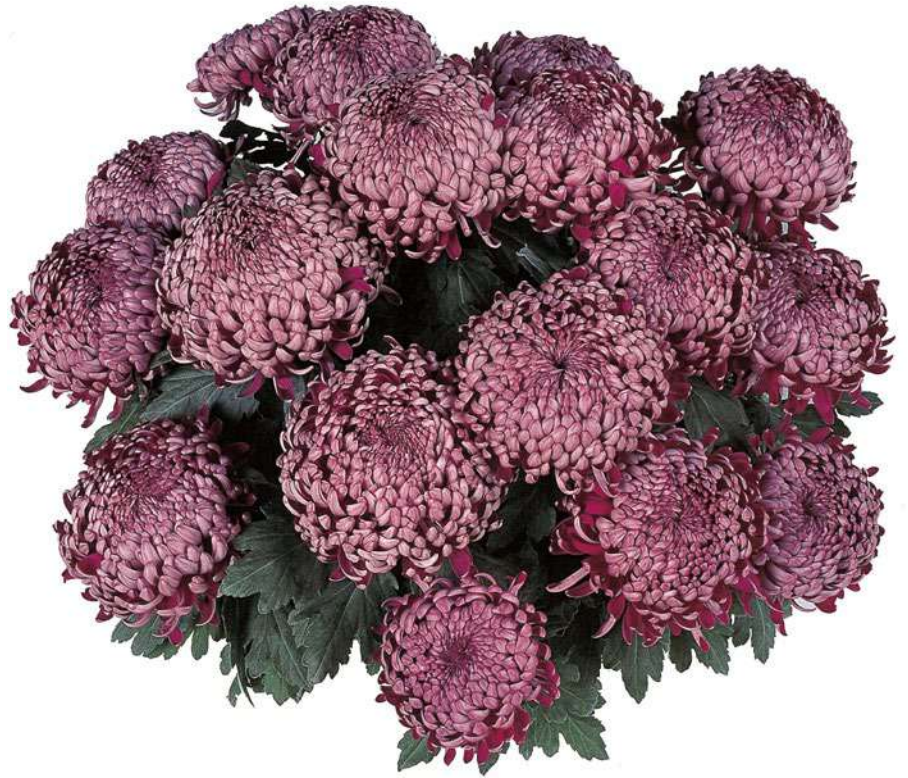
23095 | Romy R 9 £:+++ L ☼