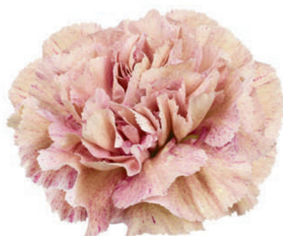
18591 | Babylon ✂️+++ ✨✓✓