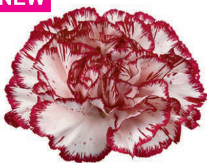
14982 | Perfect 5:+++ 4:✓✓