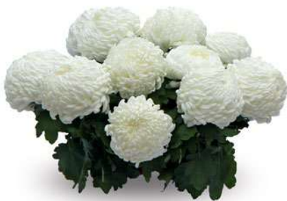
23154 | Sunberry White R 10 £:+++ L ☼