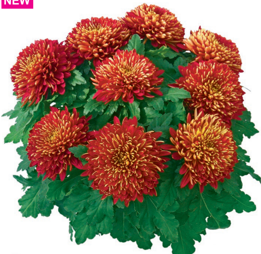
23233 | Nagano Rouge R 9,5 4:+++ L ☼