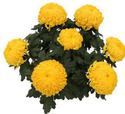
23156 | Belattia R 9,5 4:++ L ☼