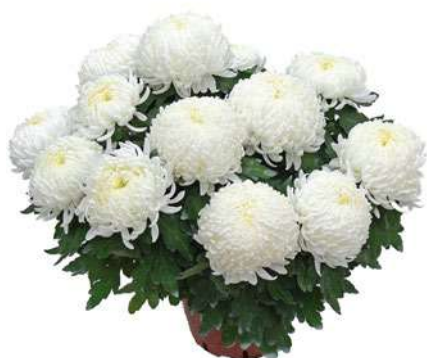
23063 | Bilkis R 9 4:++ L ☼