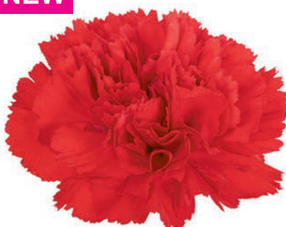
15787 | Mendoza 5:+++ 4:✓✓