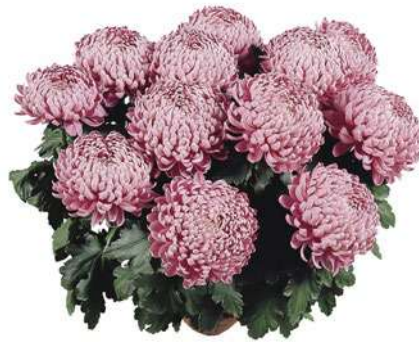
23117 | Satinblue R 10 £:+++ L ☼