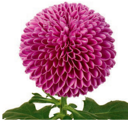
24097 | Gustav R7 4:+++ M ☼