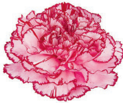
77851 | Royal Damascus ☼+++ ✨✓✓