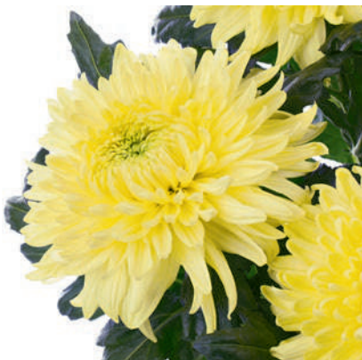
24060 | Magnum Yellow R8 4:++ L ☼