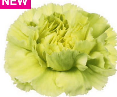
15780 | Celtic 1:+++ 2:✓✓