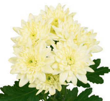
25262 | Pina Colada Cream R7 4:+++ M