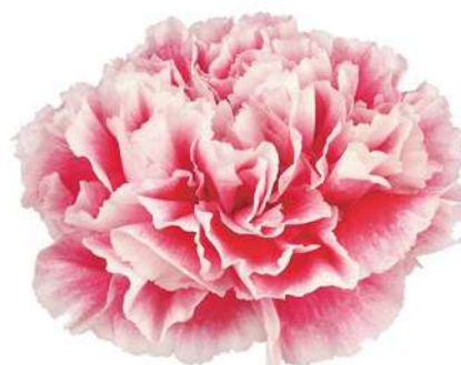
18597 | Hugo 1:++ 2:✓✓