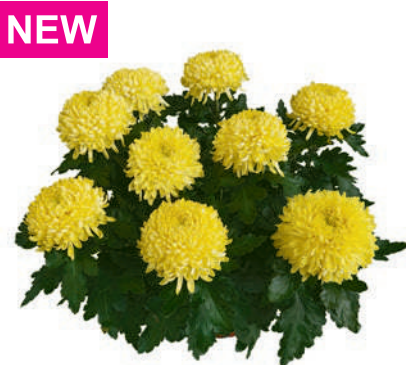
23175 | Ismara Jaune R 10 4:++ L ☼