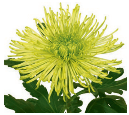
24080 | Tula Green R7 4:++ L ☼