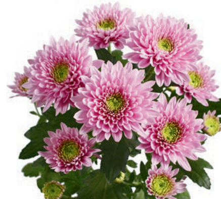
25588 | Romance R7 4:+++ M