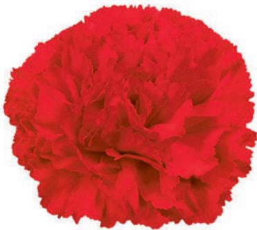
77852 | Sparta ☼+++ ✨✓✓