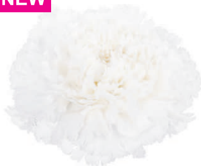
14955 | Antarctica ✂️+++ ✨✓✓