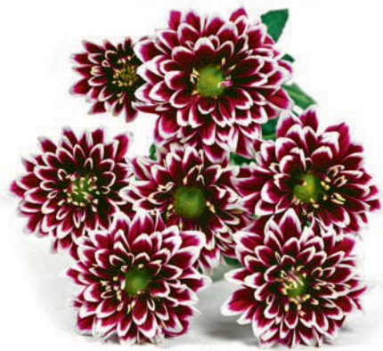
25273 | Amethyst Dark R8 4:+++ M