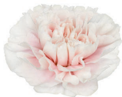
77858 | Altair ✂️+++ ✨✓✓