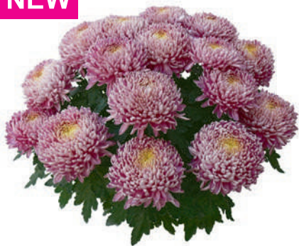
23176 | Ismara Rose R 10 4:+++ L ☼