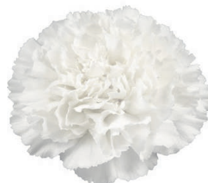
77860 | Montblanc 5:+++ 4:✓✓