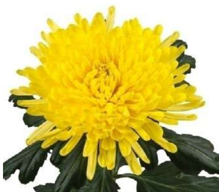
24087 | Aleksandrov R7,5 4:+++ L