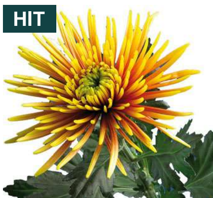
24066 | Saffina R7 4:++ L ☼