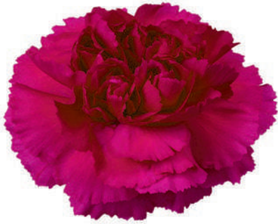
77862 | Purple Damascus ☼+++ ✨✓✓