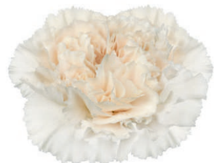
77848 | Moon Golem 5:+++ 4:✓✓