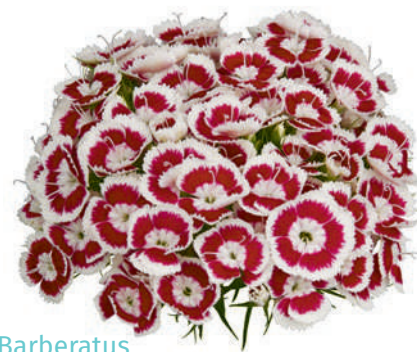
77855 | Barberatus Fresh ✂️+++