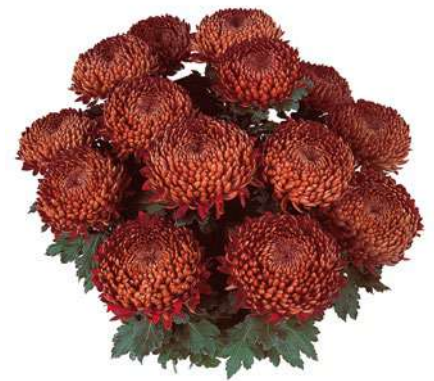
23059 | Tourbilion R 10 £:+++ L ☼