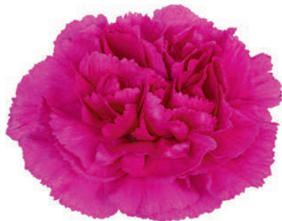
77850 | Yara ☼++ ✨✓✓