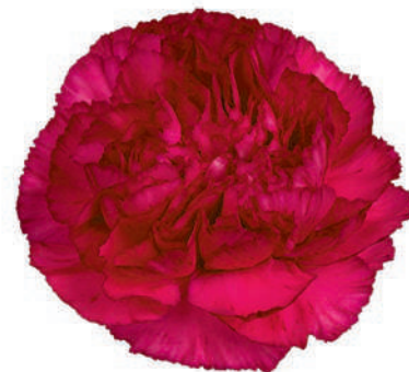
15776 | Purple Storm 5:+++ 4:✓✓