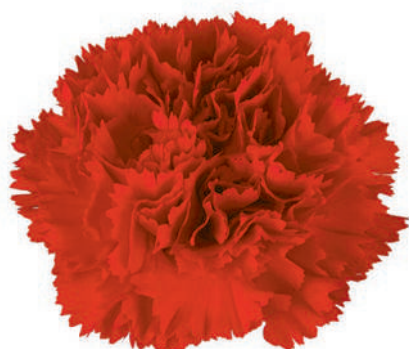
77849 | Argos ✂️+++ ✨✓✓