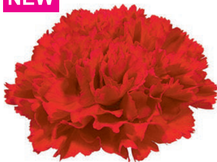
15782 | Pelayo 5:+++ 4:✓✓✓